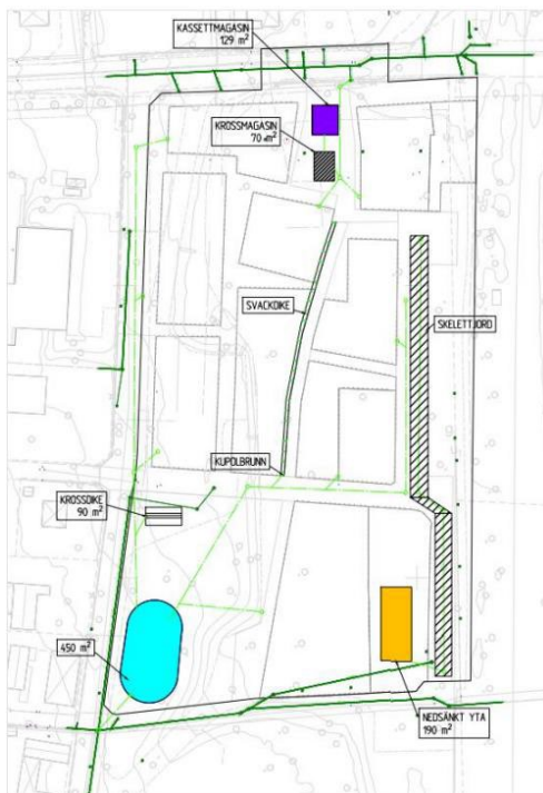
Figur 1. Föreslagna åtgärder inom utredningsområdet.

Det är svårt att ställa krav på dagvattenåtgärder på kvartersmarken. Den nedsänkta ytan (190 m 2 ) innebär att den volym som hamnar på kvartersmark i planområdet bör avledas och flyttas till den föreslagna torr dammen (450 m 2 ) vid sydvästra hörn i planområdet, se figur 1. Om en bättre reningsfunktion vill uppnås, kanske andra lösningar än en torr damm måste övervägas. Eftersom dagvattenutredningen har godkänts av NSVA, kommer mindre förändringar att behöva göras, till exempel att skapa en våt damm.